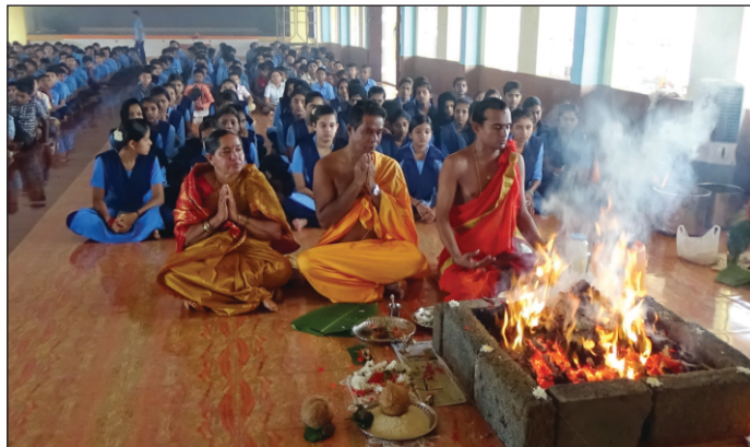
Ganapathi Havana is being Performed during the beginning of the new Academic year