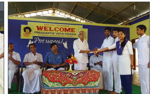
Students contributing to the School Welfare fund